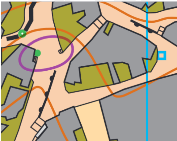
Önceki haritada merdiven örneği

Sokak giriş, çıkış ve dönüşlerde çarpışmaları önlemek için dikkatli olunmalıdır.